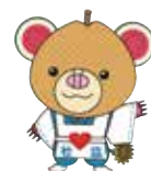
マスコットキャラクター「ちっくま」