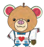
マスコットキャラクター「ちくま」

筑西市内在住で、65歳以上の方が対象です。 会場や日程につきましては、電話にてお問い合わせください。