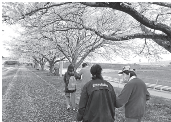
センター周辺の散歩