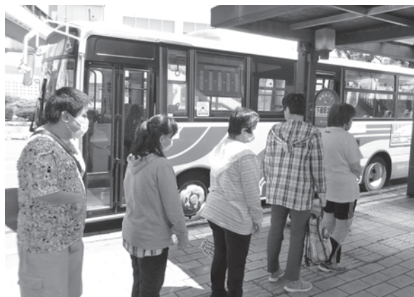
野外研修（筑西広域連携バス乗車体験）