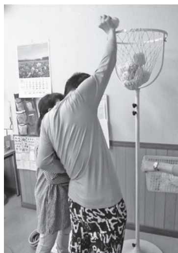
レクリエーション（玉入れ）