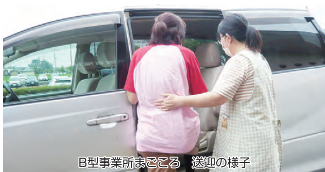
B型事業所まごころ 送迎の様子