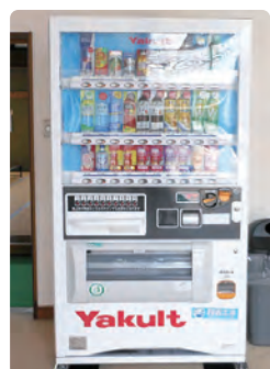
関城老人福祉センター