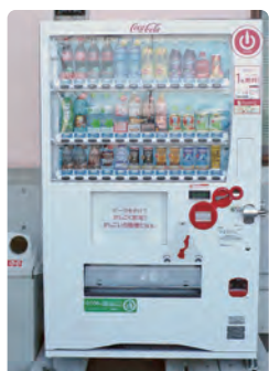
心身障害者福祉センター