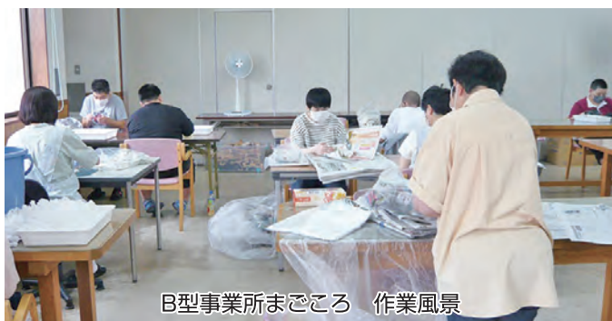
B型事業所まごころ 作業風景