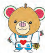
筑西市社協マスコットキャラクター 『ちっくま』