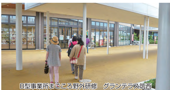
B型事業所まごころ野外研修 グランテラス筑西