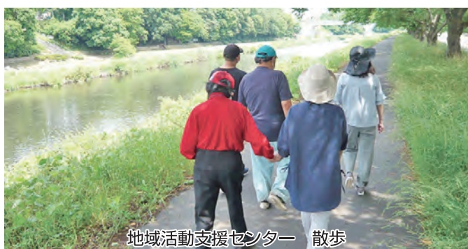
地域活動支援センター 散歩

○就労継続支援(B型)事業所まごころ… 障がい者の方の就労に向けた作業訓練や、社会的マナーを身につける研修・訓練、調理実習など、毎月行事に取り組んでいます。