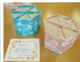
▲卒業生へ ペン立て