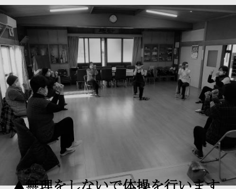
▲無理をしないで体操を行います

「3密」にならないように活動を行い、終了後は参加者全員で消毒・除菌作業を行っております。