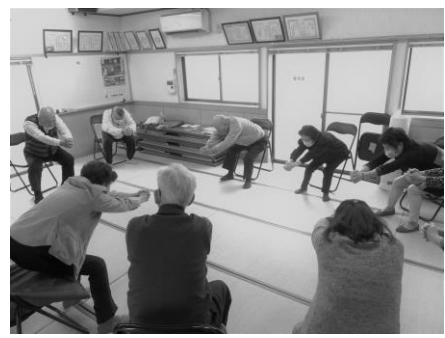
▲一つ一つの動作を丁寧に教えていただき体操をしています。

取材日：11月16日（月） クラブ：栄町栄友会 会場：栄町児童館 講師：2名（いきいきヘルス会） 参加者：8名（男性2名：女性6名） ※参加者募集中です！！