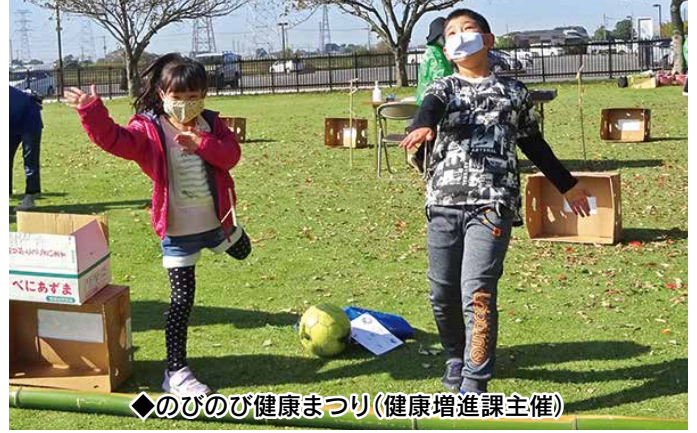
◆のびのび健康まつり(健康増進課主催)