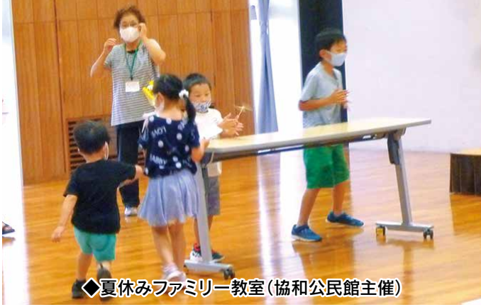
◆夏休みファミリー教室(協和公民館主催)

今年度は、協和公民館及び健康推進課から協力依頼がありました。新型コロナウイルス感染症の感染拡大防止対策を十分に取しながら、竹とんぼ作りに参加させて頂きました。大人も子供も目を輝かせて楽しんでいました。竹とんぼを通して、地域の子ども達・保護者の方々と一緒に楽しく過ごしました。