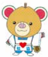
マスコットキャラクター「ちっくま」

10月2日(月)に下館駅・玉戸駅・川島駅・新治駅において、ボランティア団体や各関係機関の方々にご協力をいただき、街頭募金を実施しました。