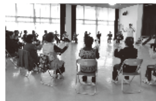
▲はつらつ教室(明野地区)