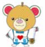
マスコットキャラクター「ちっくま」