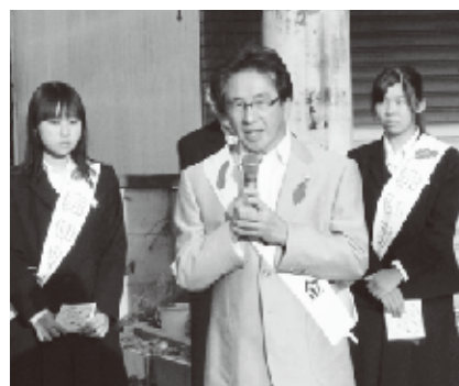
▲挨拶をする落合支会長