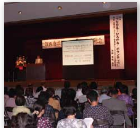
筑西市ボランティア連絡会総会