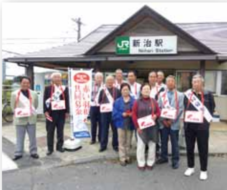
赤い羽根共同募金（街頭募金）