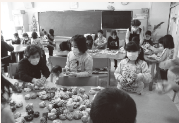
▲おぼあちゃんとお手玉遊び

去る1月27日(火)には1年生との交流会がありました。4つのグループに分かれて、お手玉やあやとり、けん玉や紙てっぽうなど昔の遊びを高齢者と一緒に行い、楽しいひとときを過ごしました。これからも小学校とのふれあいを大切に、いつまでも健康で笑いの絶えないサロンが続けられることを願っています。