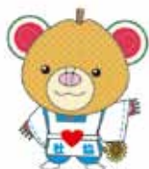
マスコットキャラクター「ちっくま」