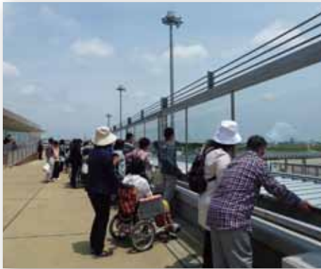
地域活動支援センター遠足