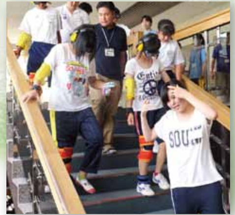
中高生福祉サマーセミナー