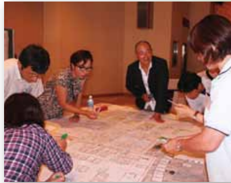
防災ボランティア養成講座