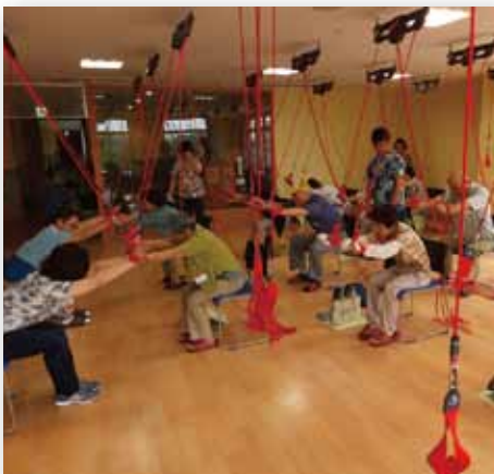
在宅福祉サービス協力会員研修会