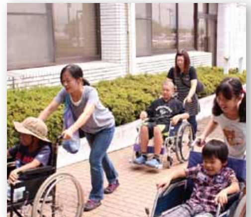
親子福祉サマースクール