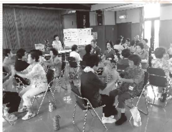
▲リトミック(音楽を取り入れた体操)