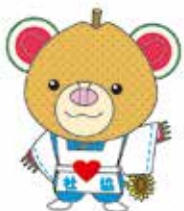
マスコットキャラクター「ちっくま」