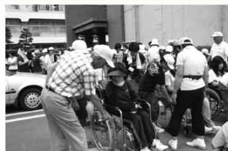
▲川島小児童・保護者の福祉体験学習指導（車いす体験）

支部事業は4つの部会体制を取っており、部会ごとに計画を策定・実施することで、地域のニーズに柔軟かつ機会を逃さない対応ができております。私たちの地域も例外なく少子高齢の波は押し寄せておりますが、「大好き！あったかーい町かわしま」をスローガンに、お互いに助け合う風土を育み・守り・伝えていきたいと思っております。