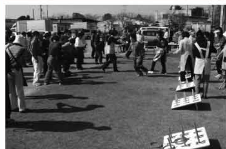
▲高齢者・女性会・ピアしらとり交流会（輪投げ大会の部）

また、五所小学校4～6年生を対象に福祉に関する100字提言を募集し、福祉への理解と啓発を図っております。今後とも地域の皆さんと連携し地域に根ざした福祉活動を推進してまいります。