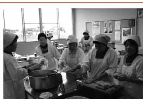
▲文化祭にて赤飯作りの様子

また、ひとり暮らし高齢者への給食サービスや、福祉協力員による日頃の地域の見守り活動も盛んに行われております。