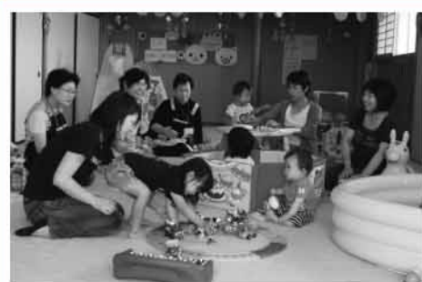
▲養蚕子育てサロン

今後とも定期的に広報紙を発行し支部活動をお知らせするとともに、地域の独自性や個性を大切にしながら、地域の皆さんと共に地域福祉活動を進めてまいります。