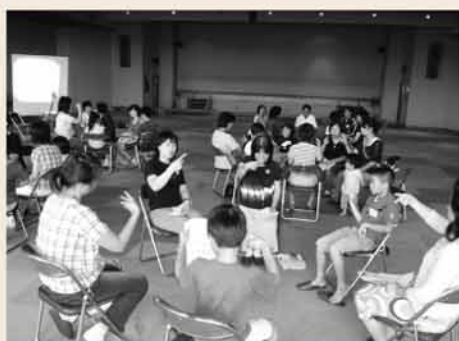
▲ 手話体験 : 耳の不自由な方の大切なコミュニケーションの1つである手話を体験します。