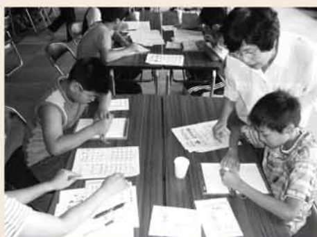
▲ 点字体験 : 公共施設や駅などでも点字は欠かせないものとなっております。点字で名刺を作ってみましょう。