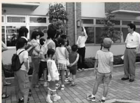
▲ 市内施設見学体験 : 市内には様々な施設があります。実際に施設を見学してみましょう。