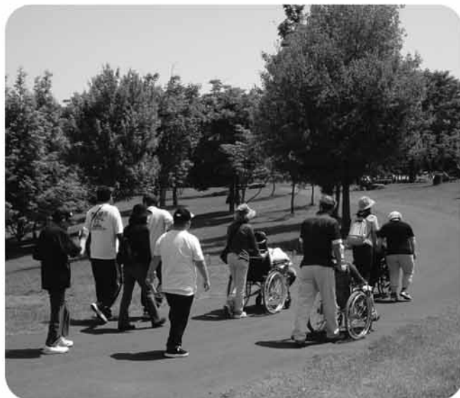
▲ 公園内を散歩する様子