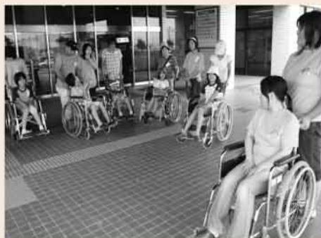
▲ 車いす体験 : 足の不自由な方の気持ちになり、信頼関係の大切さや介助方法のマナーを学びます。