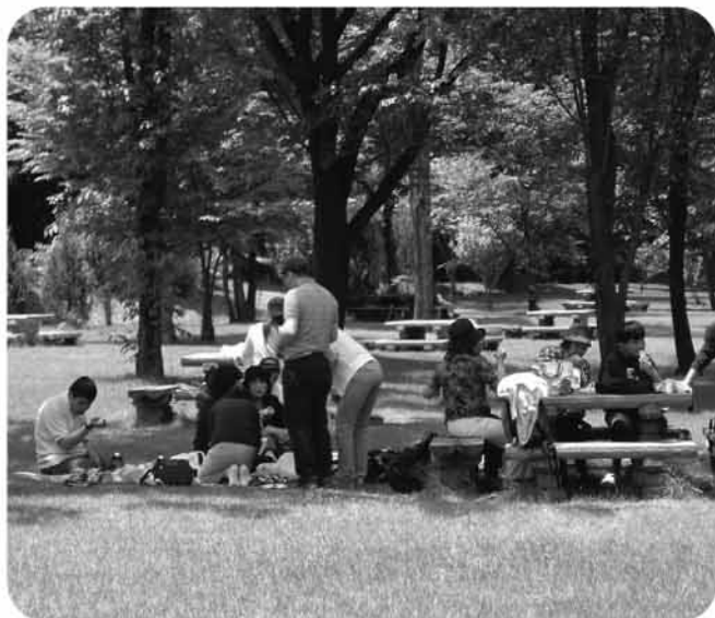
▲ おいしい昼食をいただきます！

天候に恵まれ予定通り、わんぱく公園に向け出発しました。わんぱく公園での昼食、弁当を広げおいしく頂きました。昼食後、公園内をゆっくり散策、深緑の中、時々涼しい風が肌を通りぬけて行きます。日差しもきびしかったですが園内を満喫しました。帰路思い川の道の駅に寄り、地場新鮮な野菜を両手にいっぱい購入、今回の遠足の締めくくりとなりました。当日は暑い一日でした。怪我もなく楽しくすごすことが出来ました。参加者の皆様、ご協力いただいた皆様、ありがとうございました。