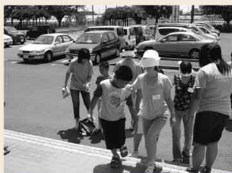
▲ アイマスク体験 : 目の不自由な方の気持ちを体験し、相手を思いやる気持ちを持つことの大切さを学びます。