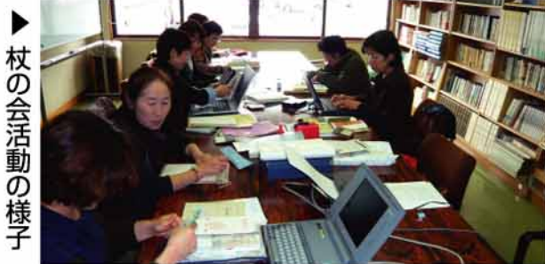
▶ 杖の会活動の様子

筑西市では、点訳ボランティア「杖の会」の皆さんが活動しています。毎週金曜日に当センターの図書室にて、広報紙や会議資料の点訳活動、イベント時には障害を持った方の介助のお手伝いを行っています。