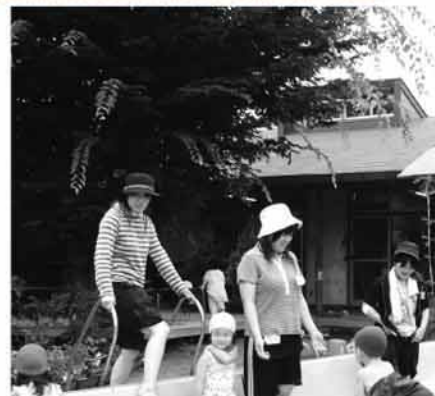
▲施設体験(市内保育園)