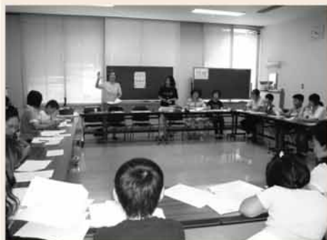
▲ 朗読体験 : 目の不自由な方に声で情報を伝える大切な方法です。参加者全員で朗読テープを作ってみましょう。