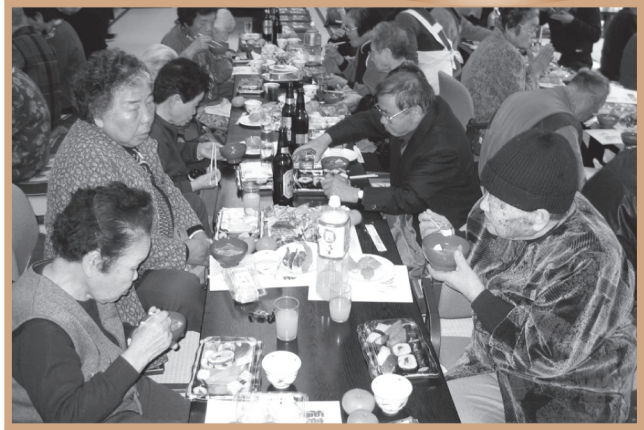
▲ おいしいけんちん汁に、にっこり笑顔