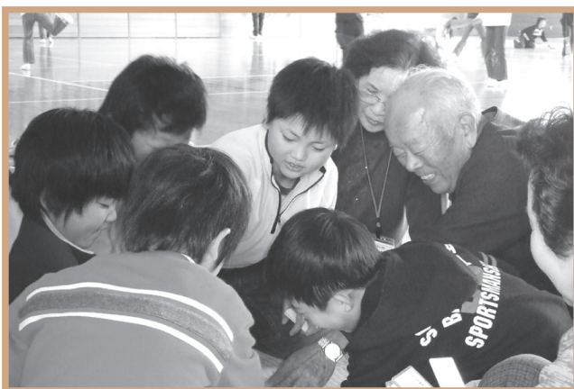
▲ 児童との交流の様子