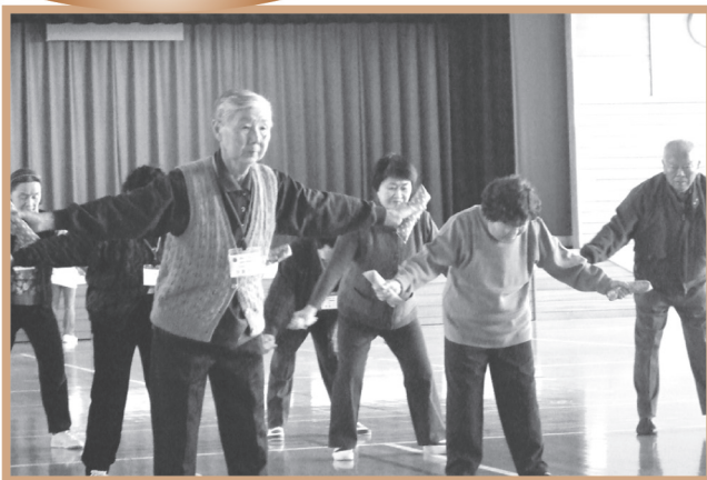
▲ 玄米ダンベル体操の様子