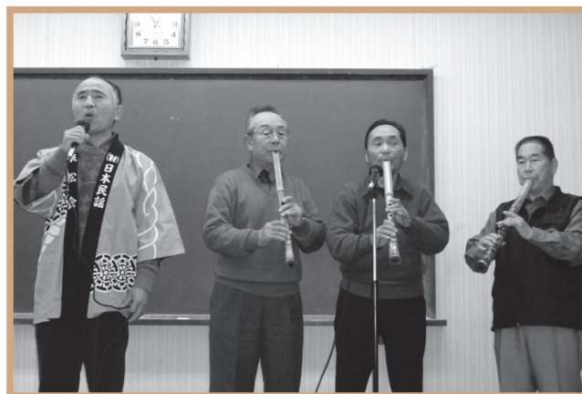
▲ 尺八と一緒に歌を披露して下さいました