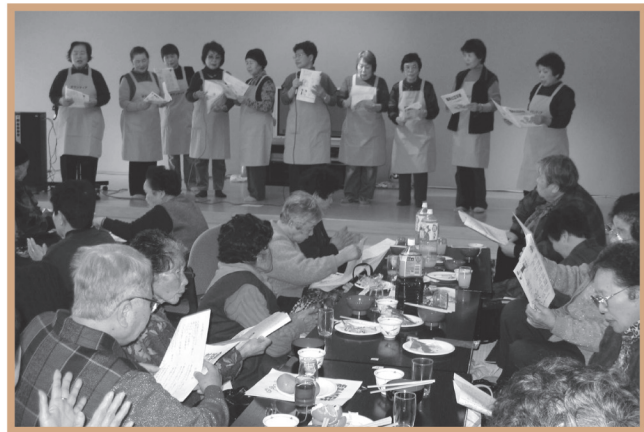
▲ ボランティアさんと一緒に歌いました