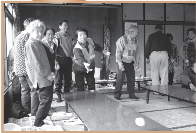
▲ ボール投げゲームの様子